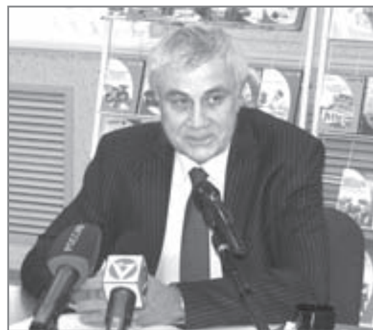
платы за поднаем жилья.